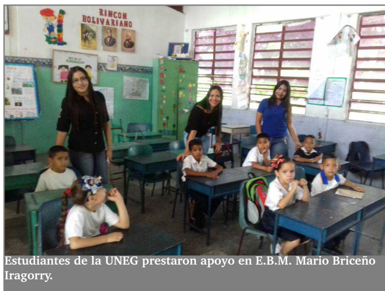
Estudiantes de la UNEG prestaron apoyo en E.B.M. Mario Briceño Iragorry.

“Las actividades desarrolladas aportaron beneficios para la institución, ya que los registros y la codificación realizada permitió al personal del colegio llevar un control eficaz de las operaciones realizadas y de la propiedad planta y equipo”, puntualizaron los universtarios. (YR)