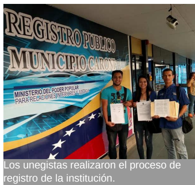
Los unegistas realizaron el proceso de registro de la institución.

Con el propósito de solventar las deficiencias existentes en el área contable administrativa del Club Rotarac Roraima, estudiantes del proyecto de carrera Contaduría Pública de la Universidad Nacional Experimental de Guayana (UNEG), aplicaron diversas herramientas aprendidas y desarrolladas durante el estudio de su carrera en orden de cumplir con el servicio comunitario establecido por ley.