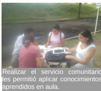
Realizar el servicio comunitario les permitió aplicar conocimientos aprendidos en aula.

Gracias al proyecto de servicio comunitario “Actualización de libros contables en la Asociación Civil Comunidad de Villa Antillana”, dicha organización logró beneficiarse con respecto a los procesos contables y de administración que deben cumplir con el propósito de continuar facilitando mejoras a la comunidad.