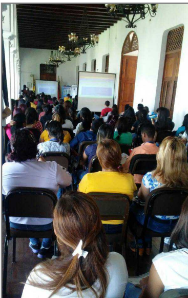
Más de cien participantes se dieron cita en las II Jornadas de Prospectiva y Finanzas de la UNEG.

Expertos en ciencias financieras se dieron cita para evaluar los "Retos y oportunidades ante la realidad económica del país". El encuentro se dio en el marco de las II Jornadas de Prospectiva y Finanzas, patrocinadas por la Universidad Nacional Experimental de Guayana (UNEG), por intermedio del Centro de Investigaciones Gerenciales de Guayana (CIGEG) y la línea de investigación en Gerencia Financiera.