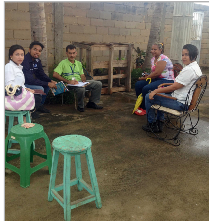
Estudiantes evaluaron servicio con la comunidad

Con la aplicación del proyecto titulado, "Filosofía de gestión y presupuesto para cambio de tuberías de aguas blancas del Consejo Comunal Riveras de Santa Rosa, Puerto Ordaz, estudiantes del proyecto de carrera Administración, mención Banca y Finanzas, dieron cumplimiento a la Ley del Servicio.