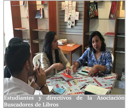
Estudiantes y directivos de la Asociación Buscadores de Libros

Cada uno de estos aspectos fueron debidamente detallados mediante la aplicación del proyecto titulado: "Tramitación y capacitación respecto al cumplimiento de los deberes formales de Buscadores de Libros, A.C", lo que sin duda será fundamental para el éxito de las actividades propias de la referida organización.