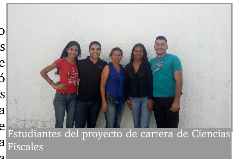
Estudiantes del proyecto de carrera de Ciencias Fiscales

De acuerdo a lo señalado por los estudiantes, este proyecto permitió identificar las necesidades en materia administrativo fiscal de la cooperativa, con la finalidad de crear una base de datos a partir de la información suministrada, registrar las actividades contables del Centro de Atención al Consumidor Agropecuario 2000, para dar cumplimiento a los deberes formales de la misma.