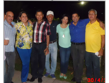
Unegistas que recordará por siempre

Si bien reconoce que la crisis nacional afecta el movimiento regular del Ipstuneg, al cual considera como un hijo que no debe abandonar, no duda en expresar su preocupación por su actual situación. "No puedo desestimar lo que sucede puertas adentro del instituto, y desde mi experiencia administrativa, considero que se deben impulsar los trámites necesarios y de forma directa con las empresas farmacéuticas, laboratorios o proveedores de medicamentos y hasta con el propio gobierno nacional, en aras de adquirir las medicinas que reclaman los afiliados, y cuyos costos es imposible atender con el ya maltrecho ingreso familiar. Debemos unirnos para continuar defendiendo al Ipstuneg, como patrimonio que nos pertenece a todos por igual"